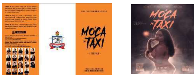
Figura 2 – Folder e Cartaz de apresentação

Nos dias 02 e 03/08/2022, a turma se reuniu para escolha da temática, cuja opção foi livre, conforme orientação do professor da disciplina. Além do mais, houve a definição do título da peça, início da criação do roteiro e estrutura. No dia 04/08/2022 foi informado o local de apresentação: Auditório Setorial Básico I, da Universidade Federal do Pará (UFPA).